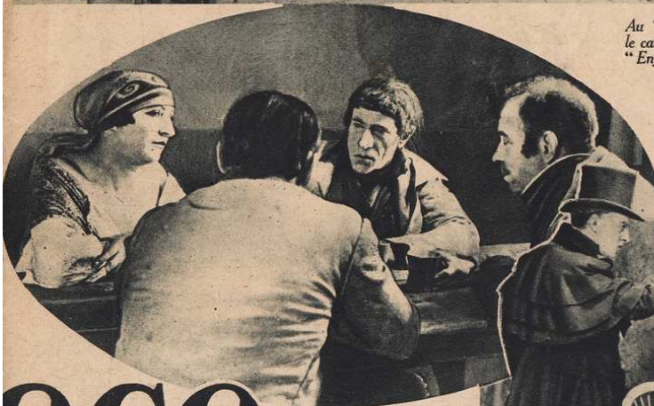
Dans les sous-sols du cabaret, les "Enfants du Soleil" conspirent.