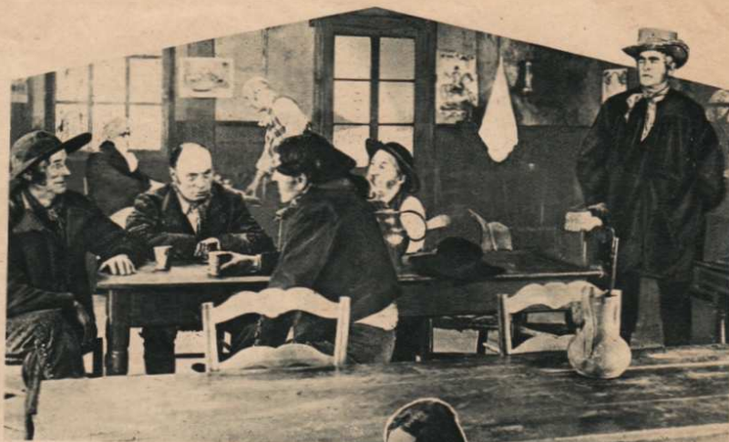
Vidocq, en paysan, écoute les conversations au cabaret du village.