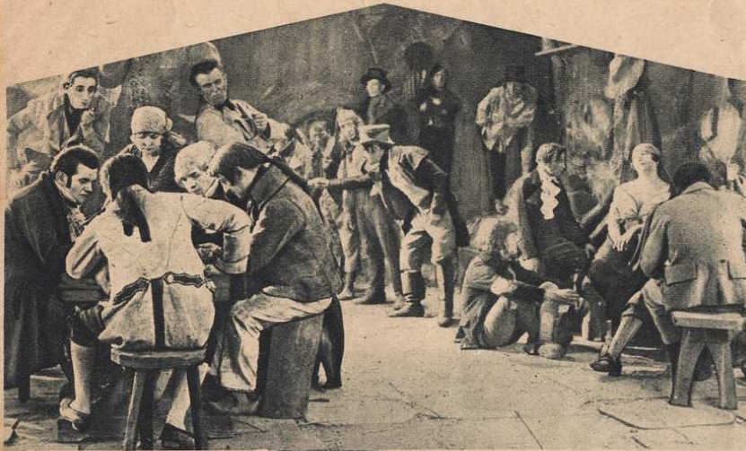
Au "Bœuf Rouge" le cabaret préféré des "Enfants du Soleil".