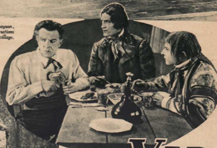
Vidocq prend son repas en compagnie de ses deux fidèles lieutenants.