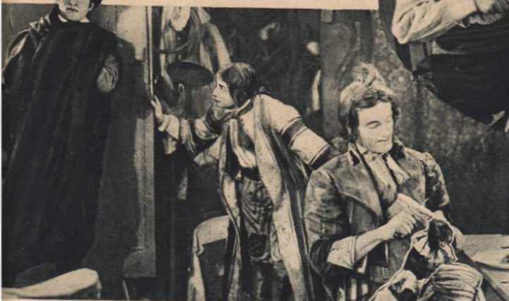
"L'Aristo" chez "Coco Lacour" et "Bibi la Grillade".