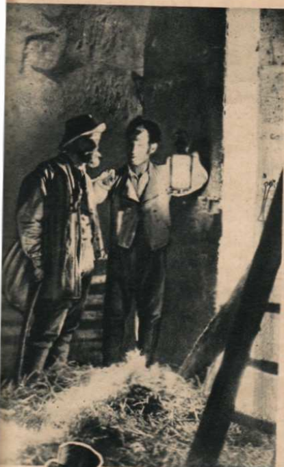
Vidocq part à la recherche de sa femme.