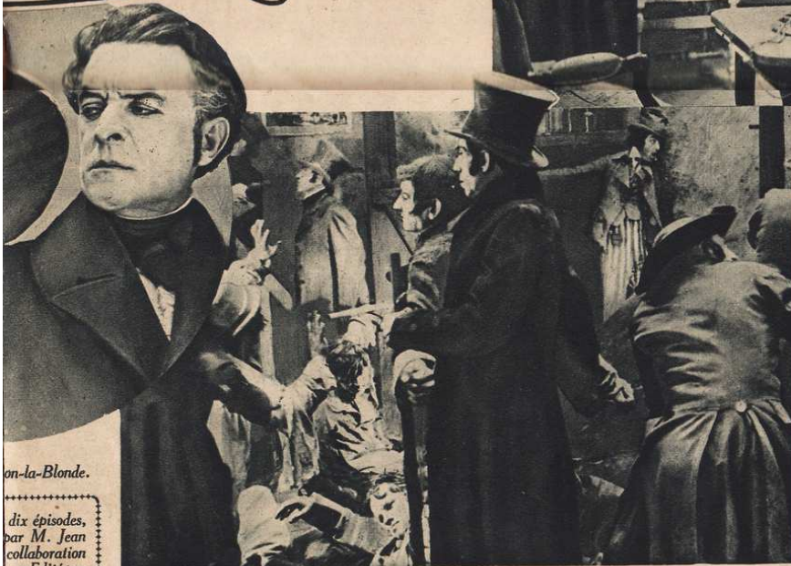
Froidement Vidocq ajusta "l'Aristo".

lui-même ses aventures et a inspiré par la suite de nombreux récits qui furent toujours lus avec passion par un public avide d'histoires tragiques. Il y avait là, vous l'avouerez, de quoi tenter un romancier et séduire un metteur en scène.